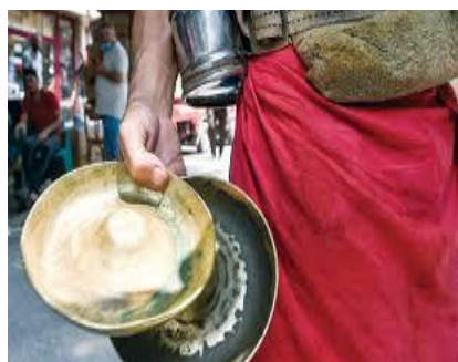
شکل ۲ سنج، ابزار موسیقایی فروشندگان شربت (الصاجات)

شربت که روی سینه خود آویزان کرده، بیان می‌شود. برای نمونه دو تصویر زیر ظاهر این فروشندگان، کوزه و پیمانه‌ها و ابزار موسیقایی آن‌ها را نشان می‌دهد.