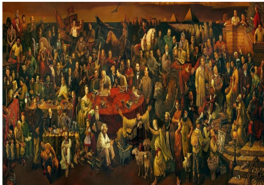
شکل ۱: گفتگویی با دانه درباره کمدی الهی

پیوند بخش‌های ناسازگار در راستای «ساختار چندآوایی کلاژ» است و نمود «پیوند گفتگویی» ۷۵ میان آنها (۴: Drag, ۲۰۲۰)، و بازتاب انگاره «کارناوال» ۷۶ یا «شادپیمایی» در اندیشه باختین است. باختین باور داشت که «کارناوال»، یا نمود «جشن‌ها و آیین‌های گروهی»، ریشه‌ای ژرف در «ناخودآگاه فردی و گروهی» دارد و «دانش کارناوالی» از دنیا از «سازشی آزاد و استوار بر آشنایی پیشین میان آدمیان» پدید می‌آید. «کارناوال» می‌تواند ناشدنی‌ترین پیوندها را در میان آدمیانی که روبرویی آنها با یکدیگر شدنی نیست، نیروبخشیده و گفتگویی آزاد و همبستگی‌آفرین در میان آنها