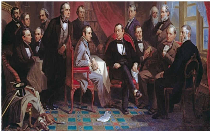
شکل ۲: واشینگتون اروینگ و دوستان فرهیخته‌اش در سانی ساید

آنچه شوسل در گزینش خود انجام داده است آشکارا در ویرایش‌های گوناگون گلچین‌های ادبی جهان همچون نورتون ۸۷ دیده می‌شود. در بررسی این ویرایش‌ها درمی‌یابیم که گاهی نویسنده‌ای که در ویرایشی پیشین شناسانده شده است، در ویرایش پسین دیده نمی‌شود. و یا با شناسایی نویسندگان برجسته هر دوره برخی از نویسندگان برجسته پیشین که کمتر در چارچوب دانشگاهی بررسی می‌شوند از این ویرایش‌ها رانده می‌شوند. در این راستا، به ویژه از سال‌های پایانی سده بیستم و با رشد جهانی‌شدن، دنیای ادبیات نیز در برجسته‌سازی نوشته‌های پیشین بیشتر تلاش نموده و در تکاپوی شناسایی آنها در ادبیات کشورهای گوناگون است. این دگرگونی در بخش‌های افزون‌شده به گلچین نورتون از شاهکارهای جهان ۸۸ در پایان سده