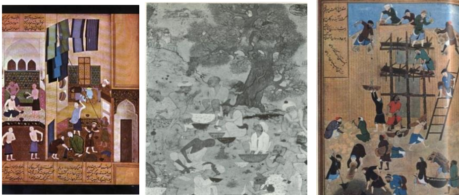
"ساختمان قلعه و قصر خورنق" "مأمون در حمام"، "کمال‌الدین بهزاد" "گلگشت" از محمدی

اجتماعی را به کل نگاره بخشیده است، تا آنجا که حتی بدون دانستن نام مینیاتور، بیننده فکر می‌کند با تصویری از واقعه‌ای حقیقی از محیط بیرون روبرو است، هر چند که روح معنوی و جهان تخیل گرای آن را هرگز نمی‌توان نادیده گرفت. این درحالی است که تابلوی گلگشت اثر محمدی (۱۵۸۷-۱۶۲۹)، در ذات موضوع (تفریح و گلگشت درویش‌ها) واقع‌گرایانه و عینی است، اما در شیوه پرداخت، رویکردی فراواقع و تخیلی برگزیده است. این تابلو که درویش‌هایی را در حالت جذب و خلسه به تصویر کشیده است «رنالیستی است» از طریق احساس به وجود آمده و در واقع رنالیسم ذات موضوع است نه صورت ظاهر آن. «(گری، ۱۳۸۳: ۴۱-۴۰).