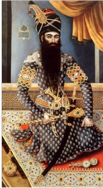
تصویر ۷ فتحعلی‌شاه نشسته با ساعت جیبی، رقم میرزابابا، رنگ روغن روی بوم، ۱۲۱۳ ه.ق، (Vide. Raby, 1999: 38)

موضوع بیشتر نقاشی‌های سیاسی و حماسی را صحنه‌های شکار شاه و شاهزادگان، فتحعلی‌شاه نشسته بر تخت سلطنت، شاه در حال جنگ با دشمنان (غالباً روس‌ها)، بازدید از سپاه و تک‌چهره‌های سیاسی تشکیل می‌دهند.