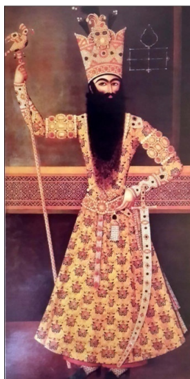
تصویر ۵ فتحعلی‌شاه ایستاده با عصای شاهی، رقم مهر علی ۵۱۲۲۶.ق. رنگ روغن روی بوم (نک. کیکاووسی، ۱۳۸۹: ۴۲)

در نقاشی‌ها نیز قد و قامت کشیده طبق همان الگوی زیبایی‌شناسی اشعار، وجه مشترک تمامی پیکره‌های مردانه و زنانه است. همچنین کشیدگی پاها، بلندی گردن و باریکی میان نیز بر زیبایی و موزونی آن افزوده است. در تک‌چهره‌های فتحعلی‌شاه که از بهترین نمونه‌های نقاشی پیکرنگاری‌های درباری محسوب می‌شوند، شاه با قامتی بلند و کشیده، کمر باریک، سینه ستبر، بازوان قوی، به همراه دستان، پاها و انگشتان ظریف که از مهم‌ترین شاخصه‌های زیبایی‌شناسی بدن محسوب می‌شوند، ترسیم شده است (نک. تصویر ۵).