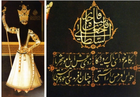
تصویر ۶ تک‌چهره تمام قد فتحعلی‌شاه، رقم مهر علی، رنگ روغن روی بوم، ۵۱۲۲۴. ق، محل نگهداری: موزه آرمیتاژ (نک. آدامووا، ۱۳۸۶: ۲۴۲)

همچنین بسیاری از شعرا با نسبت دادن اعمال پهلوانان ایرانی همچون رستم به فتحعلی‌شاه و تشبیه او به شخصیت‌های اسطوره‌ای و ملی مانند جمشید، کیخسرو، انوشیروان دادگر و غیره، سعی داشتند تا از وی چهره یک پادشاه آرمانی بسازند.