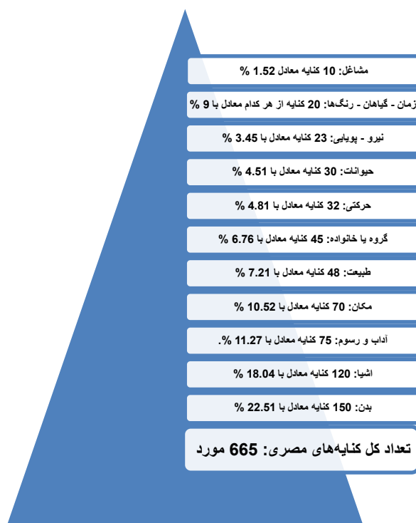
نمودار ۱: میزان فراوانی حوزه‌های مبدأ در کنایه عامیانه مصر