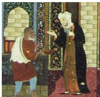
تصویر 5: نمایش گدا و سد راه وی بر در مسجد

سراسر نگاره وجود افرادی را نشان می‌دهد که هر کدام مشغول به انجام کاری هستند، تمامی این افراد در این نگاره معرف و نمایانگر نمادین مراتب اعمال مختلف انسان‌ها در مراحل مختلف طریقت هستند. اهل مناجات و استغاثه، اهل مباحثه، اهل ذکر و مراقبه، اهل نماز، عارف گدایپیشه، همگی جلوه‌هایی از انسان‌ها بشمار می‌روند. اوج مضمون و محتوای اصلی داستان در نگاره که خلاصه تصویری از عنوان را به تصویر می‌کشد، در مرکز تصویر و پایین، مرد زاهد با پوشش و جامه فاخر در مقابل پیر مرد گدا مصور شده و راه را بر او بسته‌است (تصویر 5)