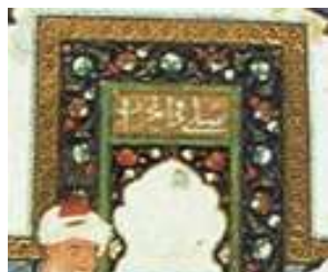
تصویر 4: عبارت "یصلی فی المحراب"

سراسر نگاره وجود افرادی را نشان می‌دهد که هر کدام مشغول به انجام کاری هستند، تمامی این افراد در این نگاره معرف و نمایانگر نمادین مراتب اعمال مختلف انسان‌ها در مراحل مختلف طریقت هستند. اهل مناجات و استغاثه، اهل مباحثه، اهل ذکر و مراقبه، اهل نماز، عارف گدایپیشه، همگی جلوه‌هایی از انسان‌ها بشمار می‌روند. اوج مضمون و محتوای اصلی داستان در نگاره که خلاصه تصویری از عنوان را به تصویر می‌کشد، در مرکز تصویر و پایین، مرد زاهد با پوشش و جامه فاخر در مقابل پیر مرد گدا مصور شده و راه را بر او بسته‌است (تصویر 5)