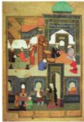
تصویر 1: گدایی بر در مسجد، اثر بهزاد، کتابخانه‌ی قاهره.

بهزاد در این اثر نمایشخانه‌ای، از خطابینی‌های عقل را برپا داشته است: فراسوی دیوار پوشیده از نقش و نگار، مسجد شکوه و ابهت خود را در نور کامل میان روز آشکار دارد. در مرکز تصویر، حیاط مسجد قرار گرفته که در انتهای آن، در سمت راست صحن و در سمت چپ، ایوان تصویر شده است. می‌توان تصویر مسجد را به دو قسم، داخلی و خارجی تقسیم کرد: دیوار خارجی مسجد کاشی‌کاری شده و مزین به نقوش طلایی و هندسی، با ترسیم گیاهانی به رنگ لاجوردی و سبز. قسمت داخلی مسجد به دو قسم تقسیم می‌شود: مقصوره مسجد و قسمتی از شبستان مسجد. در کتیبه بالا و سمت راست تصویر نیز، مزین به این آیه قرآن شده است: "و ان المساجد لله ..." (سوره جن آیه 18) با پیش‌فرض قرارداد این آیه به‌عنوان یکی از دلایل خلق تصویر توسط بهزاد و استفاده از آراء مفسران در باب کلمه مسجد به اطلاعات زیر می‌توان دست‌یافت. مفسران قرآن معنا و مفاهیم مختلفی از مسجد ارائه کرده‌اند. که در ادامه پژوهش، به منظور شناخت ارجاع‌دهی روایات و احادیث در ارتباط با این کلمه، به آن‌ها خواهیم پرداخت. چنانکه در بخشی از نگاره، در نگاره نماهای مختلف مسجد اعم از بیرون و محوطه حیاط مسجد و داخل مسجد با هم مصور شده‌اند. گنبد مسجد به سبک عصر تیموری، و به رنگ فیروزه‌ای، نمای زیبای تصویر را جلوه‌ای خاص بخشیده است. در کنار دیوار بیرونی، حوضچه‌ی مخصوص وضو قرار دارد تا کسانی که وارد مسجد می‌شوند، وضو بگیرند. پشت این دیوار می‌توان صحن مسجد را با سنگ‌فرش آن دید (نجفی، 1989، 151) (تصویر 2).