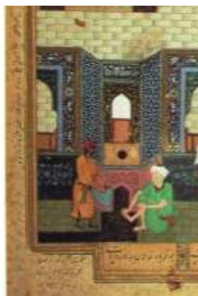
تصویر 2: حوضچه‌ی مخصوص وضو در نگاره

کلمه مسجد در چند جای قرآن آمده است: در آیه 18 سوره جن خداوند می‌فرماید: "وَأَنَا لِمَسْجِدِ اللَّهِ فَلَا تَدْعُوا مَعَ اللَّهِ أَحَدًا" «اینکه مساجد از آن خداست پس با خدا احدی را بخوانید». این آیه درست در قسمت زیر گنبد فیروزه‌ای رنگ نگاشته شده (تصویر 3) و ارجاعی بیش متنی و موضوعی از قرآن در نگاره بدست می‌دهد.