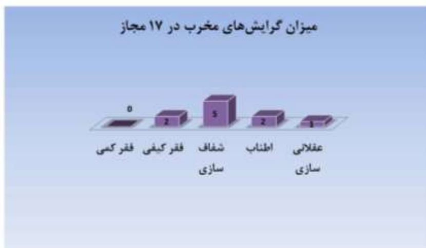
شکل ۲: گرایش‌های ریخت‌شکنانه در مجاز

در ترجمه مثال «سنبل» از غزل ۱۲۰، می‌توان شاهد اطناب بود؛ آنجا که مترجم با هدف روشن‌تر کردن بار معنایی آرایه، توضیحاتی را در گروه می‌آورد: La [senteur des boucles .de] jacinthe