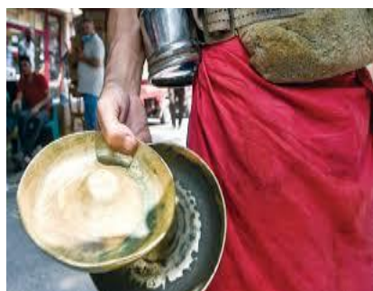
شکل ۲ سنج، ابزار موسیقایی فروشندگان شربت (الصاجات)

شربت که روی سینه خود آویزان کرده، بیان می‌شود. برای نمونه دو تصویر زیر ظاهر این فروشندگان، کوزه و پیمانه‌ها و ابزار موسیقایی آن‌ها را نشان می‌دهد.