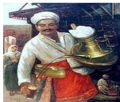
شکل ۱ فروشنده شربت شیرین بیان (بائع العرقسوس)

فروشنده با کوفتن سنج‌ها و بیان عباراتی سعی در جلب توجه مردم برای خرید شربت می‌کند. غروب است و تاریکی و سرما هر لحظه به زمین هجوم می‌آورد. مردم بی‌توجه و به‌سرعت می‌گذرند. سنج‌ها خروشان و پرهیاهو به‌صدا درمی‌آیند و با گذشت زمان و محوشدن مردم ضربات آن‌ها شدیدتر می‌شود. اما ضربه‌ها و تلاش فروشنده بی‌نتیجه می‌ماند و او دچار ناامیدی می‌شود و شدت ضربه‌های سنج‌ها فروکش می‌کند و دچار انشعاب می‌شود. سپس همچنان که خیره به جهان اطراف نگاه می‌کند، ضربه‌های پراکنده شروع به همگرایی می‌کنند و سبب شور وجد فروشنده می‌شوند. تا پایان روایت توصیف این نغمه جدید و همراهی فروشنده با آن است تا اینکه در تاریکی محو می‌شود و صدای آرام موسیقی سنج‌ها همچنان به گوش می‌رسد و کم و کمتر می‌شود.