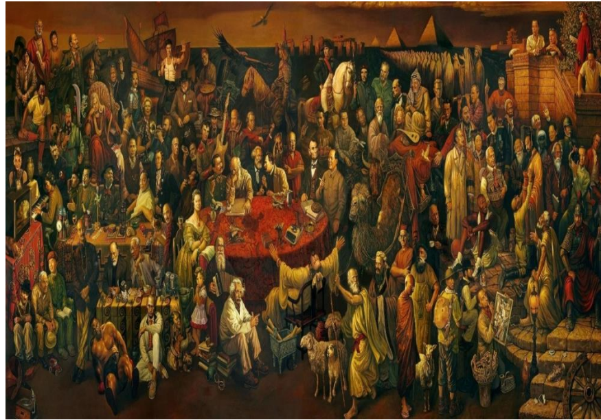
شکل ۱: گفتگویی با دانه درباره کمدی الهی

پیوند بخش‌های ناسازگار در راستای «ساختار چندآوایی کلاژ» است و نمود «پیوند گفتگویی» ۷۵ میان آنها (Drag, ۲۰۲۰: ۴)، و بازتاب انگاره «کارناوال» ۷۶ یا «شادپیمایی» در اندیشه باختین است. باختین باور داشت که «کارناوال»، یا نمود «جشن‌ها و آیین‌های گروهی»، ریشه‌ای ژرف در «ناخودآگاه فردی و گروهی» دارد و «دانش کارناوالی» از دنیا از «سازشی آزاد و استوار بر آشنایی پیشین میان آدمیان» پدید می‌آید. «کارناوال» می‌تواند ناشدنی‌ترین پیوندها را در میان آدمیانی که روبرویی آنها با یکدیگر شدنی نیست، نیروبخشیده و گفتگویی آزاد و همبستگی‌آفرین در میان آنها