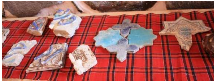
تصویر ۸. کاشی‌های زرین‌فام قلعه الموت

کاشی‌های زرین‌فام در آن دوره توسط بزرگان و برای بناهای مهم و ارزشمند به کار می‌رفت و بیشتر جنبه تزیینی داشت. احتمال می‌رود که کاشی‌های کتیبه‌دار به کتیبه‌های برجسته سر در قلعه تعلق داشته باشد؛ همان گونه که در نگاره جامع‌التواریخ نیز دروازه اصلی با کاشی‌های لعاب‌دار و کتیبه الملك لله تزیین شده است. با توجه به تشابه این کاشی‌ها با نگاره جامع‌التواریخ، می‌توان با الهام از این نگاره تصویری واقعی از قلعه الموت بازسازی کرد.