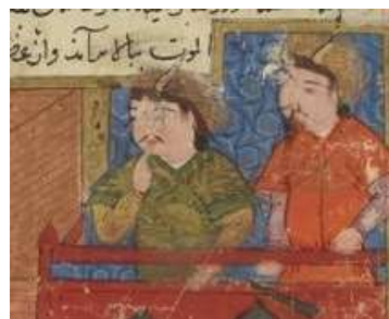
تصویر ۳. هلاکو بر ایوان قلعه الموت

فرینه دیگری که نشان می‌دهد این شخص باید هلاکو باشد، آخرین سطر متن موسوم به «سطر انقطاع» (Break-line verse) است. طبق پژوهش‌های فرهاد مهران، سطر انقطاع سطر یا سطوری از متن است که از نظر مضمون، بیشترین ارتباط را با نگاره دارد، در نود درصد موارد نقطه اوج داستان را نشان می‌دهد و نگاره مستقیماً پس از آن می‌آید (Mehran, ۲۰۰۶, ۱۵۵-۱۷۷). سطر انقطاع در این نگاره عبارت است از: «هلاکو به مطالعه الموت به بالا برآمد و از