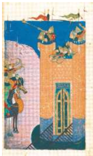
تصویر ۱۳. فتح قلعه الموت، تاریخ جهان‌گشای جوینی

تاریخ جهان‌گشای جوینی قدیم‌ترین منبع در میان کتب سنی‌مذهب ایرانی درباره یورش مغول است. این کتاب از منابع معتبر تاریخ مغول است؛ زیرا نویسنده شخصاً ناظر بسیاری از وقایع بوده و در مذاکرات مصالحه میان رکن‌الدین خورشاه و هلاکو شرکت داشته است. جوینی در جوانی به خدمت مغولان درآمد و هنگامی که مغولان الموت و دیگر قلاع نزاری را تسخیر کردند همراه آن‌ها بود. او شاهد حوادثی بود که به سقوط نزاریان منجر شد و چنانکه پیش‌تر اشاره گشت، او بود که کتابخانه الموت را از آسیب مغول نجات داد و زندگی‌نامه حسن صباح را در کتاب خویش آورد. با اینکه جوینی از دیوان‌سالاران مغول بود، اما در شرح وقایع از بیان حقایق ابایی نداشت. این اثر تاریخ سیاسی محض نیست، زیرا نویسنده هنگام شرح وقایع درباره اوضاع اقتصادی، اجتماعی و موقعیت جغرافیایی اماکن نیز توضیحات منحصربه‌فردی داده است.