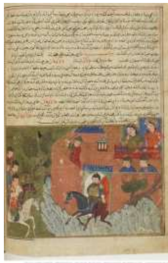
تصویر ۲. قلعه الموت

یکی از نسخ مصور جامع‌التواریخ خواجه رشیدالدین فضل‌الله همدانی، به شماره Sup ۱۱۱۳ Persan در کتابخانه ملی فرانسه نگهداری می‌شود. تاریخ این نسخه ۱۴۳۰ - ۱۴۳۴ م. / ۸۳۳ هـ است و نگاره‌هایی به سبک مکتب تبریز دارد. دست‌نویس مذکور تا دوره قاجار در ایران بود ولی در سال ۱۸۸۹ م. / ۱۳۰۶ هـ توسط کتابخانه ملی فرانسه خریداری شد (رک: سایت کتابخانه گالیکا).