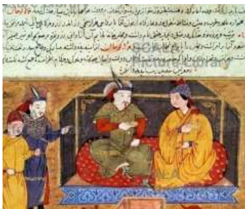
تصویر ۴. هلاکو خان و همسرش، جامع التواریخ

نگاره فتح قلعه الموت، قوم مغول را در حالی نشان می‌دهد که تا دروازه قلعه پیش رفته‌اند و هلاکو بر فراز قلعه به نظاره ایستاده است (تصویر ۲). در این نگاره همه افراد کلاه‌خودهای آهنی بر سر دارند، به جز دو مرد مغولی در گوشه سمت راست تصویر که بالای ایوان ایستاده‌اند. این دو مرد کلاه‌هایی با لبه خز و پر بزرگی بر جلوی آن، بر سر دارند که همان کلاه ویژه مغولی است. مرد سمت چپ با جامه سبز هلاکو خان مغول است (تصویر ۳). تصویر هلاکو در نگاره‌های دیگر این نسخه نیز با همین شمایل و کلاه ترسیم شده است؛ نظیر نگاره هلاکو در کنار همسرش بر تخت پادشاهی (تصویر ۴). نوع کلاه و پوشش هلاکو در هر دو نگاره یکسان است؛ یعنی کلاه مغولی، ردای سبز زربفت و مزین به نقوش طلایی.