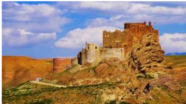
تصویر ۱. نمایی از ویرانه‌های قلعه الموت

پس از ویرانی الموت، از مخروبه‌های این قلعه فقط به‌عنوان تبعیدگاه و زندان استفاده کردند.