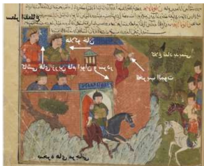
تصویر ۵. تصویرنویسی قلعه الموت

بی‌ارتباط به این آیه نباشد: «و اصحاب الشمال ما اصحاب الشمال» (واقعه / ۴۱). از منظر نگارگر نسخه که در عصر تیموری زیسته و خاطره دهشتناک حمله و هجوم مغول در ذهنش باقی است، این کلاغ پیام‌آور نحوست و بدیمنی مغولان است که هر جا می‌رود با خود جنگ و نیستی به بار می‌آورد؛ همان گونه که در تاریخ جهان‌گشای جوینی آمده است، چنگیز در مصلی بر منبر رفت و خود را عذاب خدا بر مردم دانست.