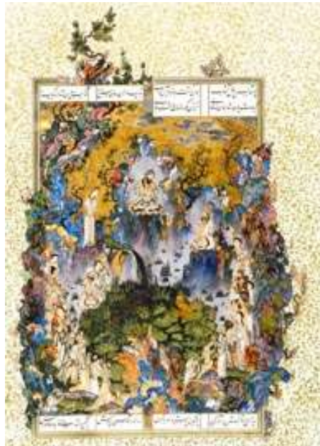
تصویر ۶. صخره‌های مرجانی در نگاره بارگاه کیومرث تصویر ۷. بزرگ‌نمایی صخره‌ها