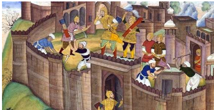
تصویر ۱۱. بخش بالای تصویر، قلعه الموت

جامه رزم بر بالای دروازه قلعه ایستاده است، در حالی که از عظمت و هیبت دژ حیرت کرده و انگشت تعجب به دهان گرفته است. چند نفر فاقد جامه رزم با تن پوش و آستین های بالازده، شالی سفید بر سر و پیشبندی بر کمر، قصد تخریب قلعه را دارند و تیشه و کلنگ به دست گرفته اند، دیوارها را در هم می شکنند و خشت و خاک را از فراز قلعه به سوی خندق فرومی ریزند. در گوشه راست مردی که لباس قرمز بر تن دارد در درون اتاقکی به دیوار تکیه زده است و گویی با تحسر ویرانی دژ را نظاره می کند (تصویر ۱۱).