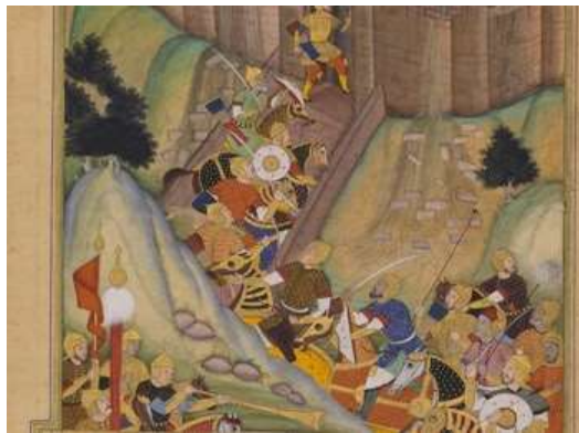
تصویر ۱۲. بخش پایین تصویر، خندق و موقعیت کوهستانی الموت

تنها دروازه و یگانه‌راه ورود به قلعه در انتهای ضلع شمال شرقی و مدخل راهی که به این دروازه منتهی می‌شود، چند متر پایین‌تر از برج شرقی و تقریباً در امتداد آن قدری به طرف شمال واقع شده است. در این محل تونلی به موازات ضلع جنوب شرقی قلعه در تخته‌سنگ پایه بریده شده است (ستوده، ۱۳۴۵: ۱۰۴). احتمالاً این همان گذرگاهی است که در نگاره بخش بالا و پایین تصویر را به هم متصل می‌کند.