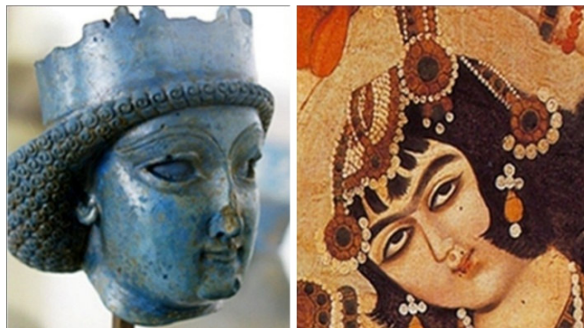
تصویر ۲ سمت راست: دختر رقصنده با نام شکر، بدون رقم، رنگ روغن روی بوم، ۱۸۴۰ م. (Vide. Falk, 1972: 45)

با دقت در اشعاری از سبک بازگشت که به توصیف چهره پرداخته‌اند و بررسی تک‌چهره‌های پیکرنگاری درباری، تداوم شاخصه‌ها و معیارهای زیبایی آرمانی ۱۴ در هنرهای دیداری ایران باستان را می‌توان مشاهده کرد (نک. تصویر ۲).