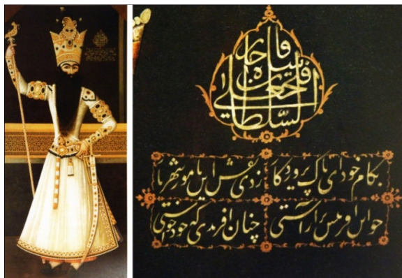
تصویر ۶ تک‌چهره تمام قد فتحعلی‌شاه، رقم مهر علی، رنگ روغن روی بوم، ۵۱۲۲۴. ق، محل نگهداری: موزه آرمیتاژ (نک. آدامووا، ۱۳۸۶: ۲۴۲)

همچنین بسیاری از شعرا با نسبت دادن اعمال پهلوانان ایرانی همچون رستم به فتحعلی‌شاه و تشبیه او به شخصیت‌های اسطوره‌ای و ملی مانند جمشید، کیخسرو، انوشیروان دادگر و غیره، سعی داشتند تا از وی چهره یک پادشاه آرمانی بسازند.