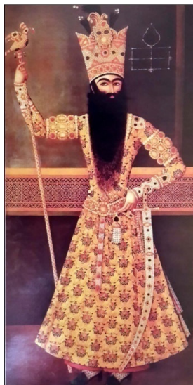
تصویر ۵ فتحعلی‌شاه ایستاده با عصای شاهی، رقم مهر علی ۵۱۲۲۶.ق. رنگ روغن روی بوم (نک. کیکاووسی، ۱۳۸۹: ۴۲)

در نقاشی‌ها نیز قد و قامت کشیده طبق همان الگوی زیبایی‌شناسی اشعار، وجه مشترک تمامی پیکره‌های مردانه و زنانه است. همچنین کشیدگی پاها، بلندی گردن و باریکی میان نیز بر زیبایی و موزونی آن افزوده است. در تک‌چهره‌های فتحعلی‌شاه که از بهترین نمونه‌های نقاشی پیکرنگاری‌های درباری محسوب می‌شوند، شاه با قامتی بلند و کشیده، کمر باریک، سینه سستبر، بازوان قوی، به همراه دستان، پاها و انگشتان ظریف که از مهم‌ترین شاخصه‌های زیبایی‌شناسی بدن محسوب می‌شوند، ترسیم شده است (نک. تصویر ۵).